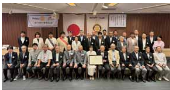
ガバナー公式訪問