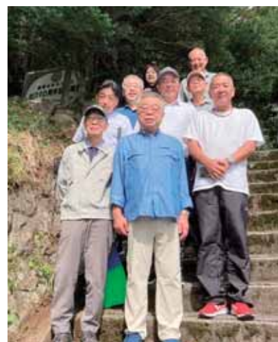
山紅葉下草刈りの様子