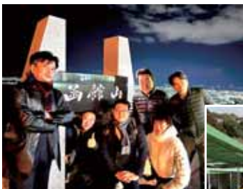
家族親睦旅行函館