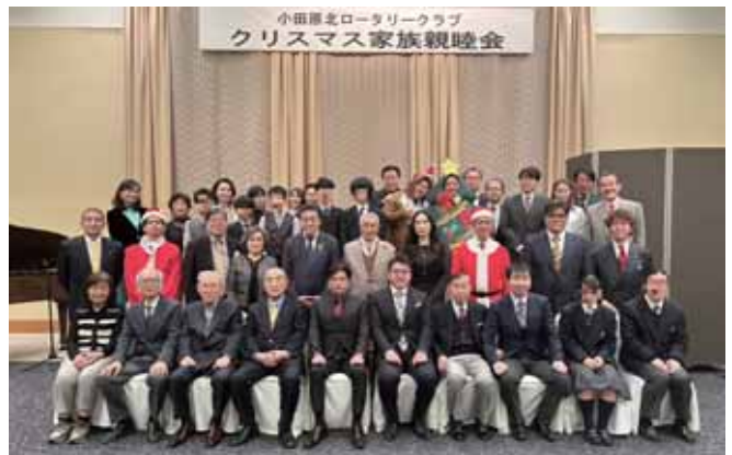
クリスマス家族親睦会