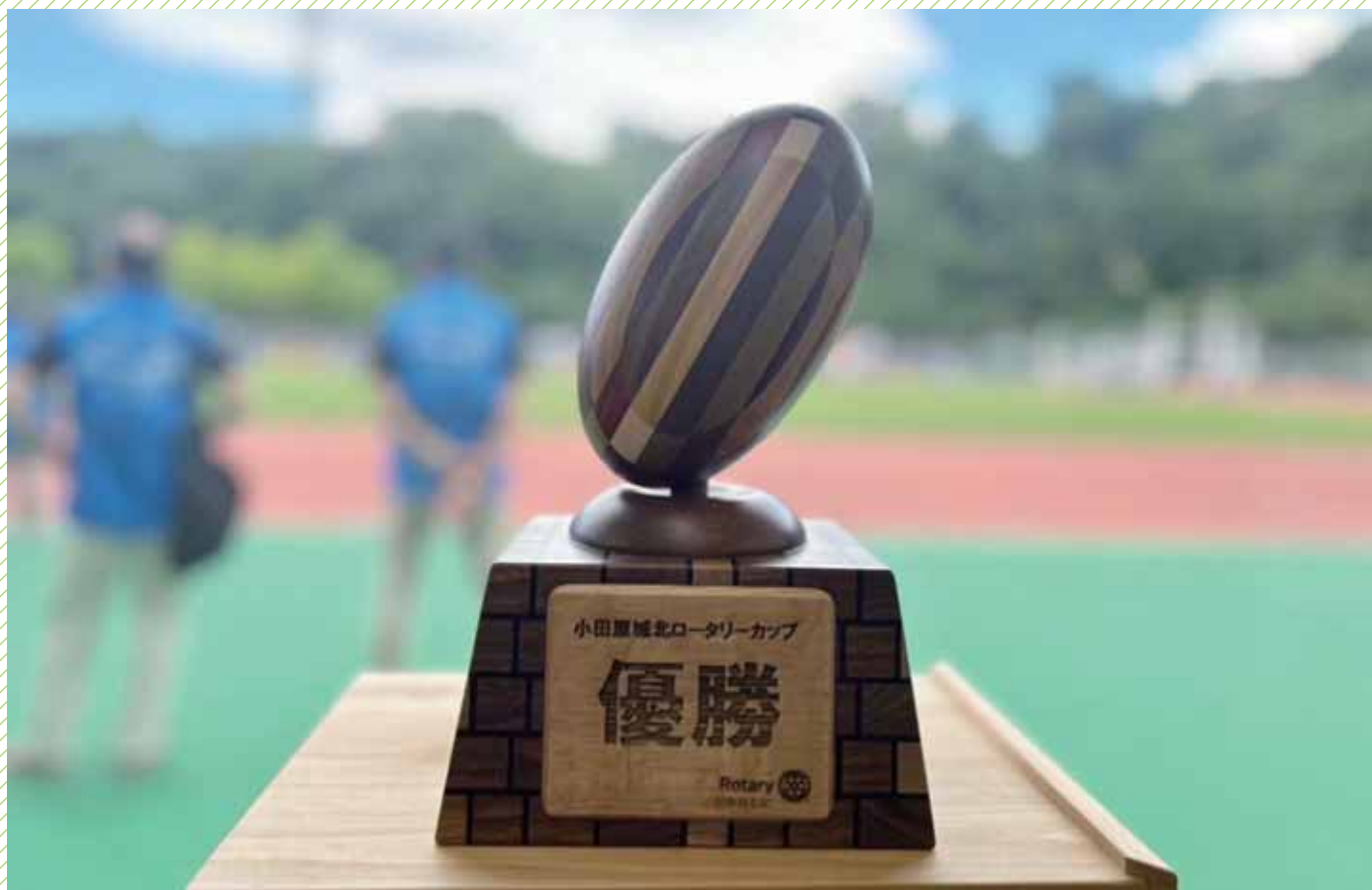
小田原城北ロータリーカップ

小田原城北ロータリーカップは昨年からはまった小学生による少年少女ラグビー大会です。第1回大会は小田原城山競技場で県内外から結集した12チームにより熱戦が繰り広げられました。優勝チームにはクラブ会員が作成した箱根寄木細工の優勝トロフィーが贈呈されます。