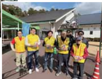
肥後大津RCとのポリオ募金活動